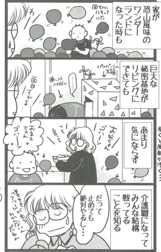
ママとはこんなヒト